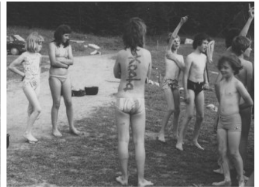
Dr Dräggsäulidaag—die traditionelle Schlammschlacht